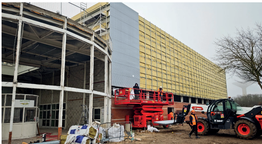
L'isolation thermique du centre sportif Coubertin, l'un des bâtiments les plus énergivores du patrimoine municipal, est un enjeu essentiel de ce grand chantier lancé par la ville.

Après avoir été mise à nu et ouverte à tous les vents, la grande salle du centre sportif Coubertin s'est revêtue très récemment. Une étape dans son habillage final, qui devrait s'achever au printemps. La façade sera alors habillée en inox gris anthracite, interrompue par une vitre continue d'un mètre en partie basse. Un revêtement qui sera aussi celui des autres parties de l'édifice pour les phases suivantes, qu'on pourra qualifier en deux mots : sobriété sur le plan environnemental, et contemporain sur le plan esthétique. Camille Chammas, architecte municipal en charge de la bonne marche du chantier. «Nous respectons le planning prévu, et avançons en même temps sur l'intérieur de cette salle 1, qui subit un décapage complet et d'importants travaux de mise en conformité des réseaux et un nouvel éclairage optimisé». Cette salle 1 doit être à nouveau opérationnelle à la rentrée prochaine, pour transférer alors le chantier vers les salles 2 et 3 qui