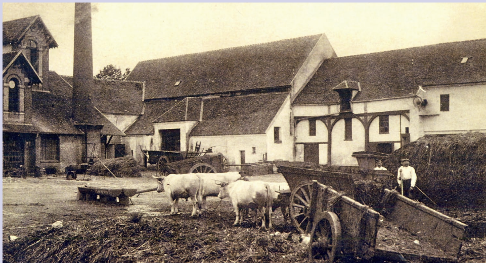
La cour centrale de la Ferme du Manet au début du 20 e siècle, lorsque la distillerie de betteraves, démolie en 1955, la clôturait et que jusqu'à 70 bœufs tractaient les charrettes.