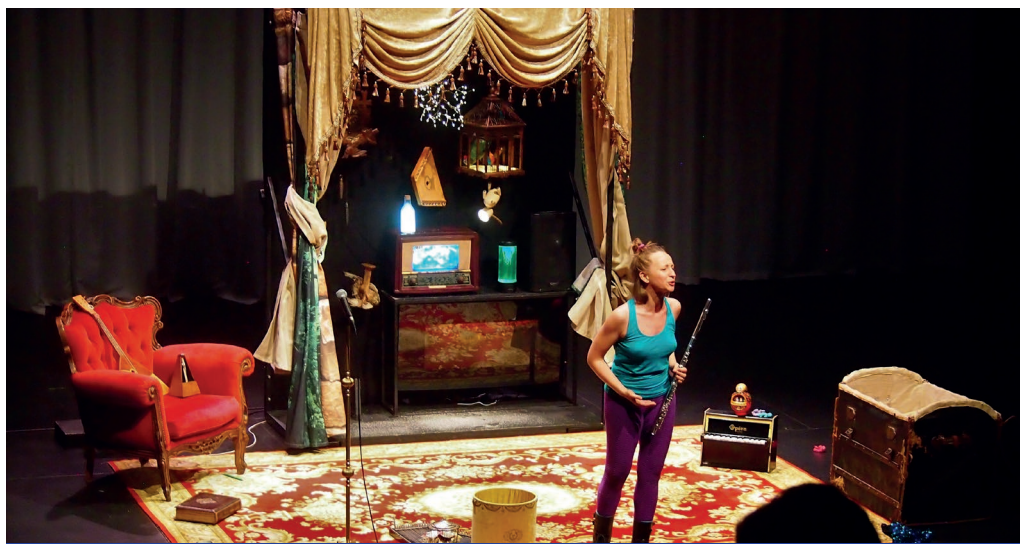
«Puisque c'est comme ça, je ferai un opéra toute seule !», un spectacle musical pour les plus jeunes, à partir de 5 ans.