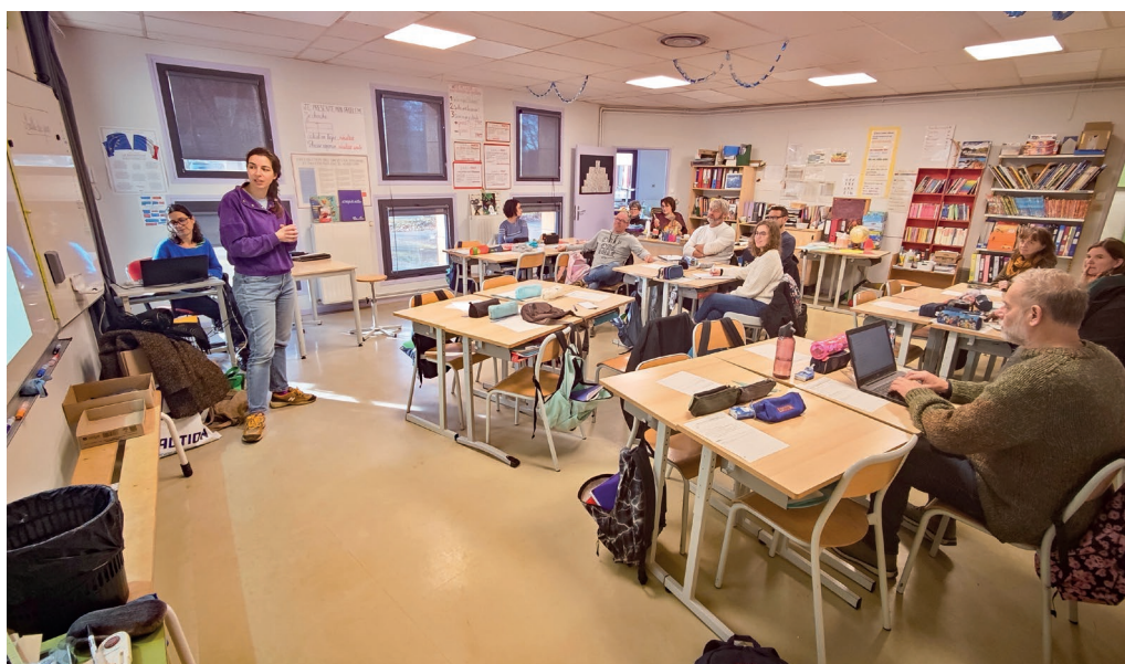
Le moment briefing conduit par le CAUE le 9 décembre, devant l'équipe enseignante de l'école Jules Verne et les services de la ville impliqués dans le projet de végétalisation des cours d'école à Montigny.

Ces travaux s'appuient à l'école Jules Verne sur l'expertise des professionnels du CAUE (Conseil d'Architecture, d'Urbanisme et d'Environnement) des Yvelines, basé à Montigny. «Nous avons mené cinq ateliers depuis la rentrée avec les élèves de CE1 de l'école pour les sensibiliser et les confronter au sujet en leur permettant d'exprimer leurs souhaits. Que voudraient-ils y trouver, quelles contraintes existent ? Les ateliers se sont achevés le 16 décembre, et en parallèle, l'équipe enseignante et les agents de la Ville ont suivi les avancées de nos échanges et ont pu livrer leurs propres réflexions», indique