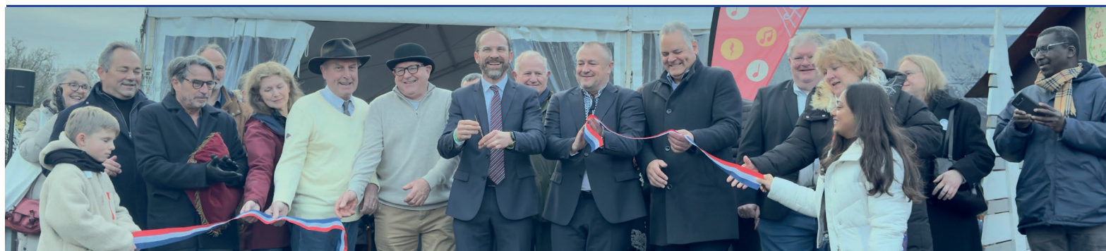
Coupé de ruban international, comme de coutume au Marché de Noël qui accueillait trois délégations anglaise, allemande et ukrainienne, le 6 décembre, à la Ferme du Manet.

Chères Ignymontaines, Chers Ignymontains,