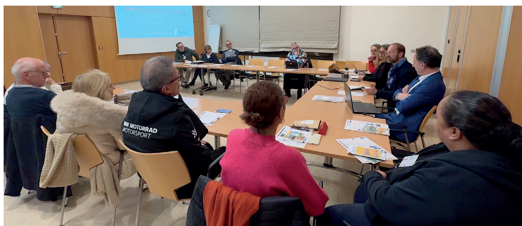
Cinq amicales de locataires des résidences ignymontaines échangeaient avec la Municipalité le 9 décembre.

Si le manque de bénévole est une difficulté rencontrée par tous, parmi les réussites citées figurent les réhabilitations thermiques et les changements de système