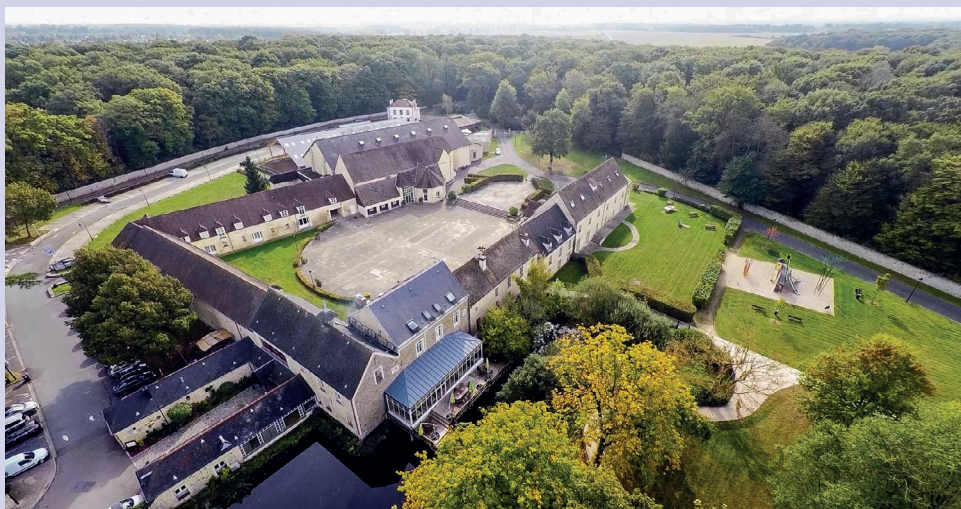
Achevée d'être réhabilitée par la Ville en 1991 et désormais ouverte aux Ignymontains, la Ferme du Manet a retrouvé son lustre patrimonial et sa place de premier plan parmi les sites emblématiques de Montigny.

Général de Gaulle des cinq villes nouvelles autour de Paris. L'agriculture se trouve purement et simplement rayée de la carte sociale et économique de Montigny.